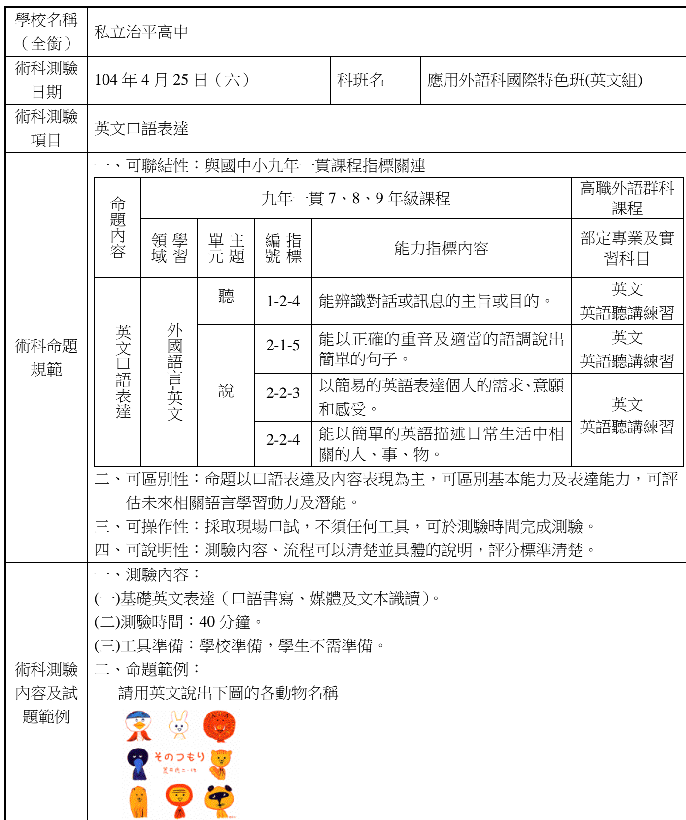
104 學年度高級中等學校特色招生職業類科甄選入學術科測驗內容審查表