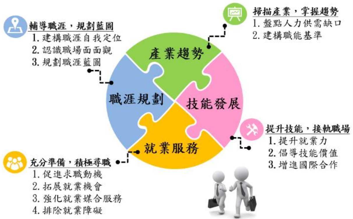
圖 1 投資青年就業方案策略圖